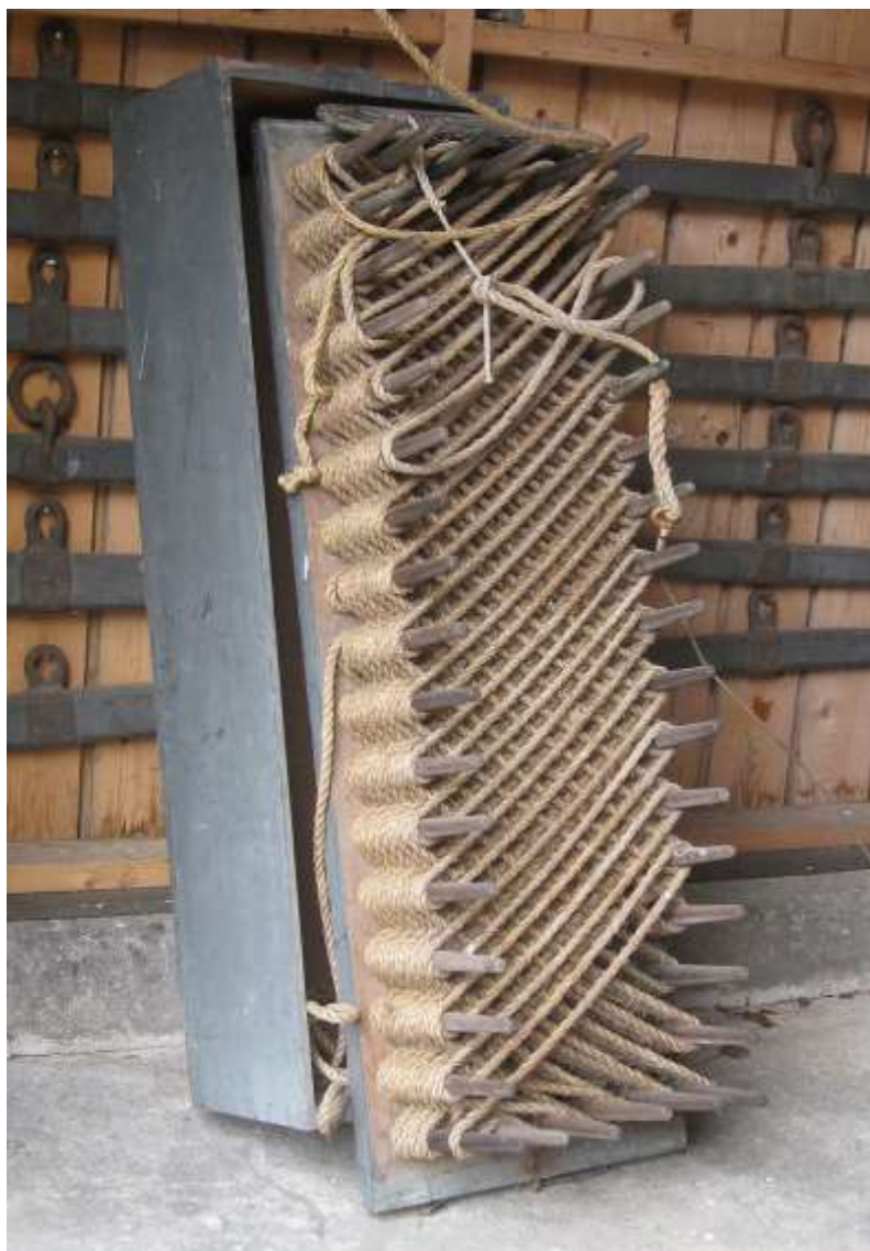
Redningsstol og oprullet raketline, Sandhammerens redningsstation, Skåne.

Dokumenterne fra og med 1845 opbevares derfor stadig i Snogebæks Byarkiv, da de hverken er kommunale eller statslige.