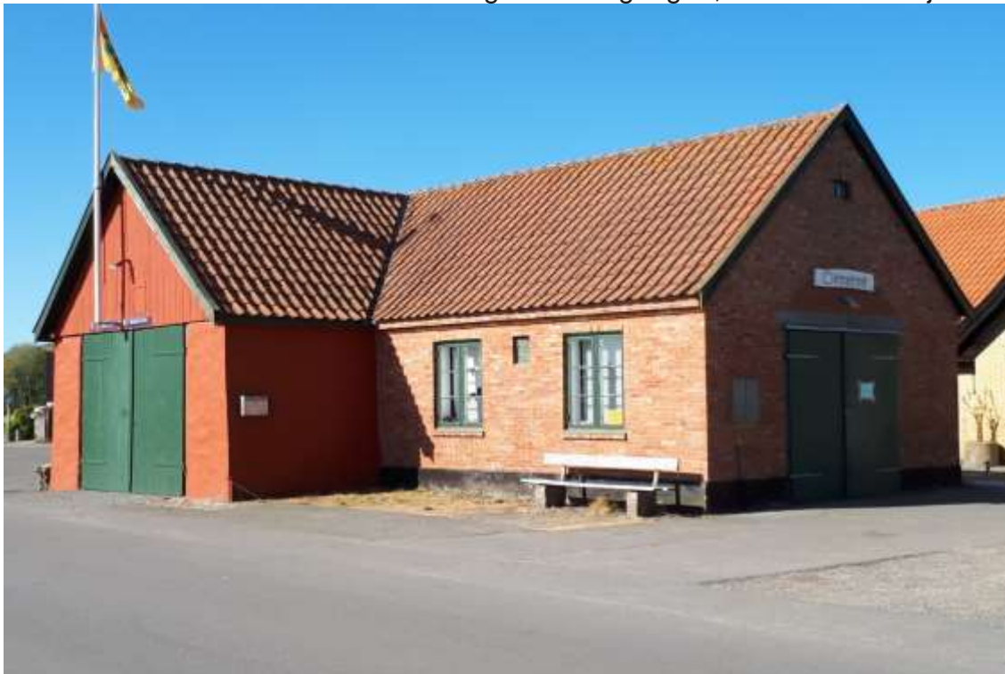
hovedvagt i Rønne

om fritagelse for værnepligt, da man ”jo allerede på havet risikerede liv og lemmer for fædrelandet”. Krigsministeriet afviste, redningsstationen måtte nøjes med en ordning, hvorefter kun en enkelt redder fra Snogebæk ad gangen, skulle møde til tjeneste på